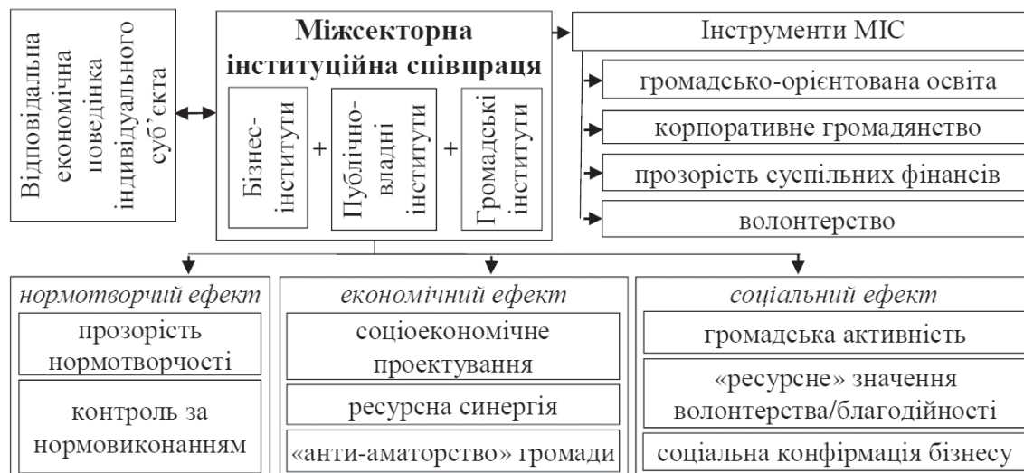
Рис. 2. Комунітарний субмеханізм реалізації СВ як соціоекономічного феномену

інститутів (рис. 2). Організуючи фасилітацію для індивідів, комунітарний субмеханізм одночасно виявляється зумовленим їхнім відповідними психоментальним профілем і поведінкою (тобто результатом функціонування ментального субмеханізму).